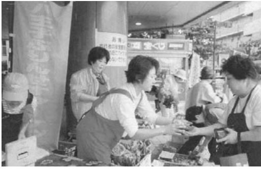
市民で賑わう直売風景（八王子市北野町）