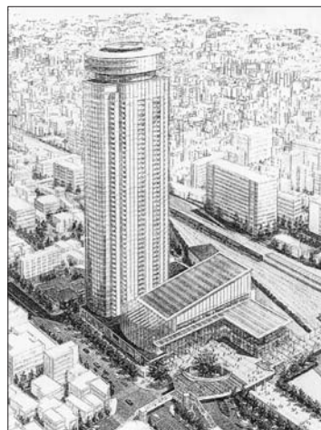
JR八王子駅南口再開発イメージ図

市民会館の改築についてもそうです。駅前の賑わいを作り出し、市民にとっての利便性を高めるため、また耐用年数が2007年までであることから前倒しで再開発事業の一環として建て直す、と議会の中で市側は説明しています。また、再開発事業は(次頁へつづく)