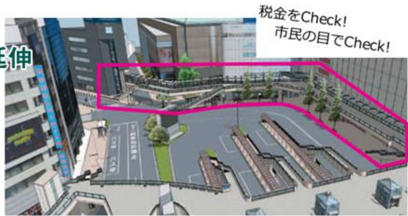
▲完成予想図。□内が延伸部分 広報はちおうじ 2012.3.1

8月7日。市議8名で、市長に計画の見直しの申し入れをしました。私たちは3度の調査で、京王プラザ前の交差点の安全は信号機設置で担保できることがわかりました。警察関係者も立ち会っての調査でした。そのことから、見直しの要請、ならびに工事発注をしないことを求めました。